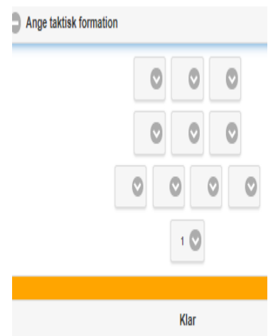
Figur 10 – taktisk formation