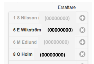
Figur 8 - Laguppställning, Ta bort spelare

Formationen visas med målvakten längst ner och forwards överst.